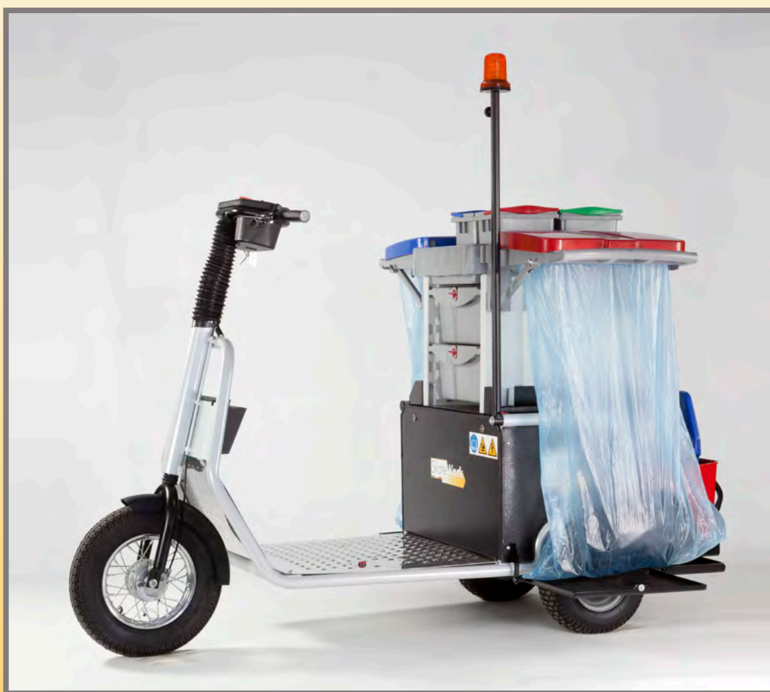
Kit Pulizie Fil_1 Fil_1 cleaning kit